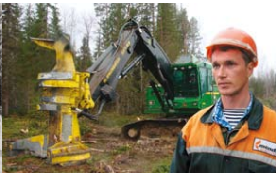
Современная техника заготовки леса, 2008 г.