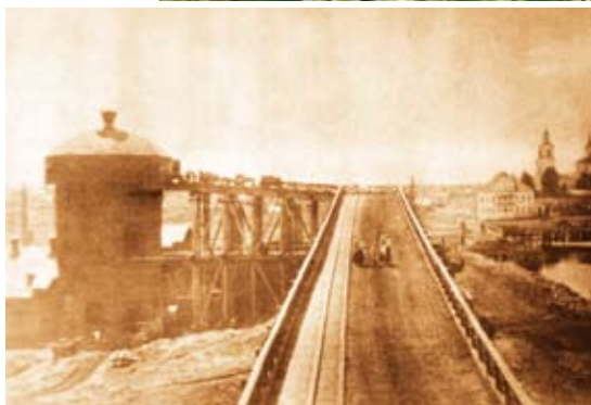
Кажимский чугунолитейный завод, 1920 г.

Первые дома в Койгородке были построены в местечке «Кулига», на высоком месте, а потом стали заселяться и места вблизи ручьев Кузиха и Пома-шор. Там же возвели