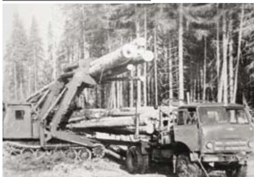
Погрузка леса. 1970-ые годы

Социально-экономическая ситуация в Койгородском районе характеризуется с положительной динамикой промышленного производства, оборота организаций, объема пиломатериалов и цельномолочной продукции, оборота розничной торговли, объема платных услуг, роста инвестиций. Выросли пенсии и среднемесячная заработная плата.