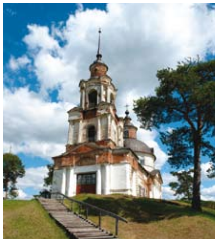
Церковь им. Дмитрия Ростовского в п. Кажым

Революция 1917 года, затронула и Койгородскую волость. Первые революционные комитеты были созданы в с. Ужга и с. Койгородок. В годы Гражданской войны территория нашего района оставалась в руках красных. Через Кажым шли отряды Красной Армии в наступление.