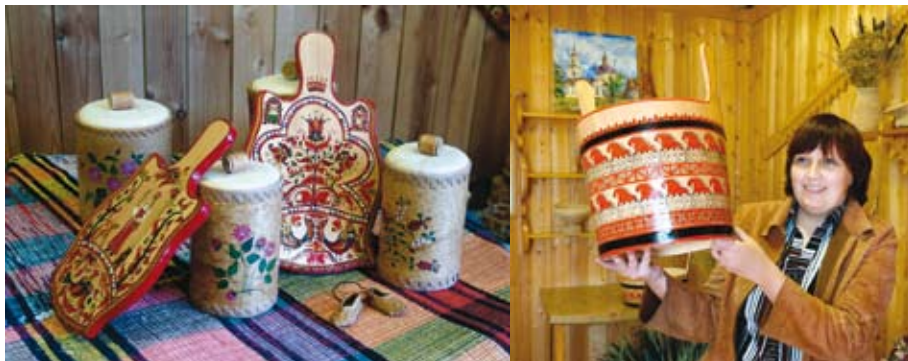
Берестяные изделия мастера Г. Н. Миняевой

Сегодня общественная, культурная и духовная жизнь в районе интересна и разнообразна, возрождаются традиции православия и народного творчества. Сфера культуры Койгородского района состоит из различных учреждений и представлена широким спектром социальных услуг, которые обеспечивают информационно-библиотечное обслуживание населения, осуществляют культурно-досуговую и кино-концертную деятельность, поддержку народного творчества и любительства, художественное и музыкальное начальное образование, сохранность и популяризацию музейного фонда.