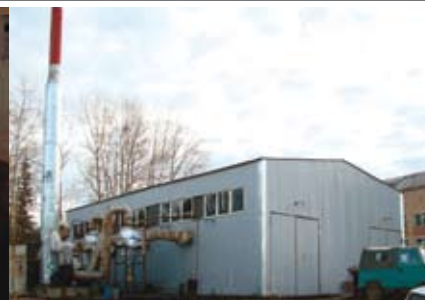
Новая котельная в с. Койгородок