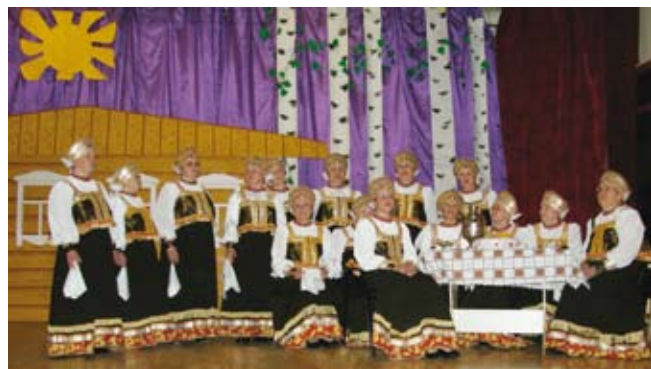
Народный коллектив «Рябинушка»