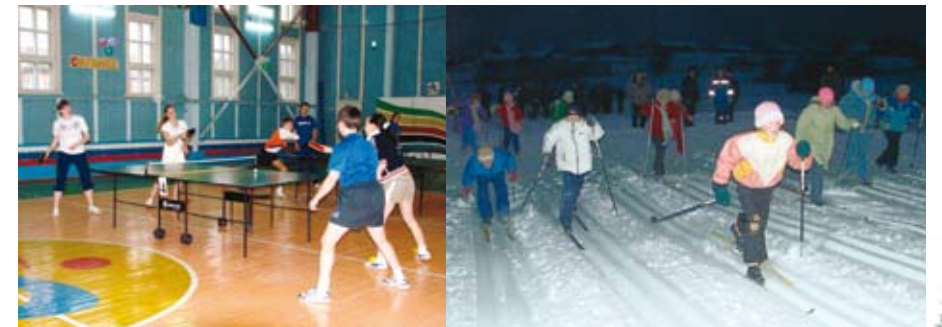
Занятия в спорткомплексе (2008 г.), освещенная лыжная трасса (2009 г.) в с. Койгородок

Юные футболисты Койгородского района ежегодно участвует в Общероссийском проекте «Мини-футбол в школу» и занимают призовые места.