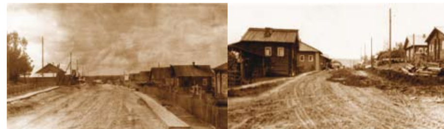
Первые улицы с. Койгородок

Многие направленные в те годы в район специалисты навсегда связали свою судьбу с Койгородским районом. С образованием района стало преобразовываться и само село. В 1954 году было введено в эксплуатацию административное здание, где размещался райисполком и райком, в 1955 году был построен первый жилой дом по улице Советской, в эти же годы население райцентра получило электроэнергию.