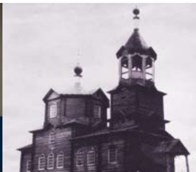
Деревянная церковь п. Нючпас

и деревянную часовню Афанасия Великого. Первые обитатели погоста носили фамилии Торопов, Шаньгин, Бурко, часть жителей, и вовсе не имела фамилий, а только прозвища: Пospelко, Копыто, Жданко. В 1678 году была возведена деревянная церковь «нерукотворного образа Спасава».