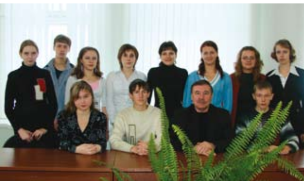
Выпускники школы с главой района, 2007 г.