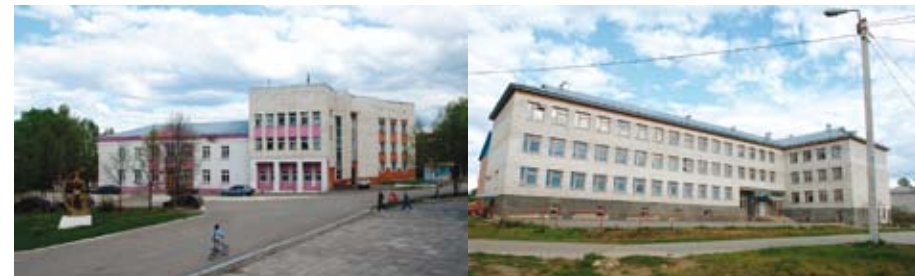
Здание администрации Койгородского района