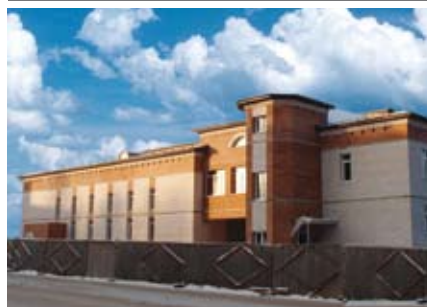
Строящийся Центр культуры, 2008г.