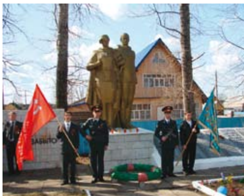
Монумент погибшим в годы ВОВ