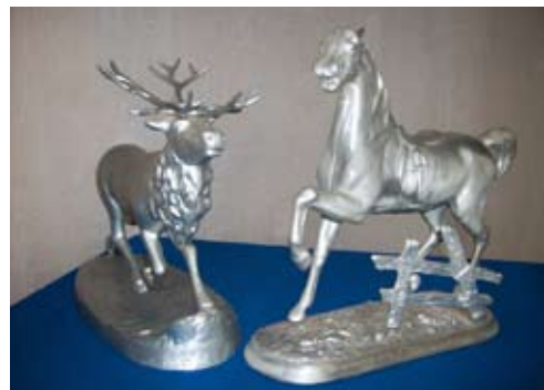
Экспонаты краеведческого музея