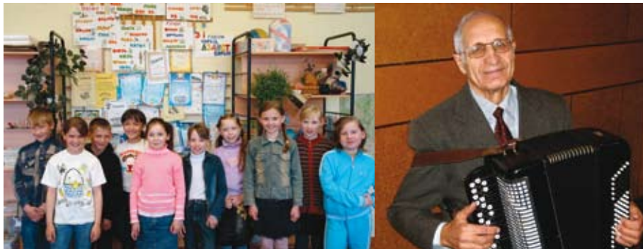
Музей Койгородской средней школы

С марта 2001 года на базе Койгородской Центральной библиотеки действует Информационно-маркетинговый центр по предпринимательству, оснащенный современной компьютерной техникой. В Центре можно получить консультацию по правовым вопросам, проблемам малого бизнеса.