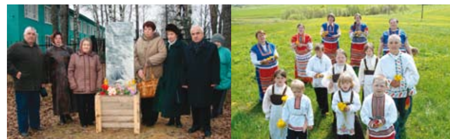
Открытие памятного знака «Жертвам политических репрессий» в п. Койдин, 2008 г.